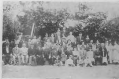
Vista del almuerzo celebrado el mes pasado en los jardines de La Tropical por la sociedad de promotoras de niños de la Habana.