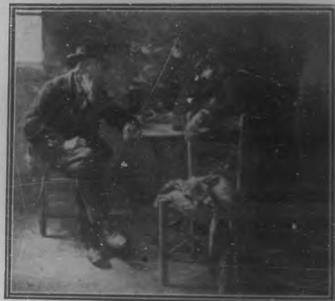
RINCÓN DE CAFETIN

Y al hablar de la peregrinación, el nombre del pintor