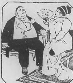
La gordura es peligrosa y ridícula